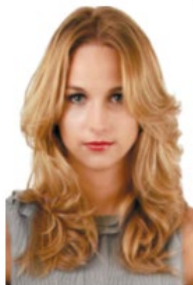
Nathalie //p. 48

Demander aux apprenants de mettre leurs connaissances en application en analysant ces 3 visuels :