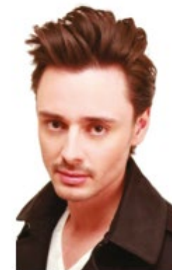
Alexis //p. 82